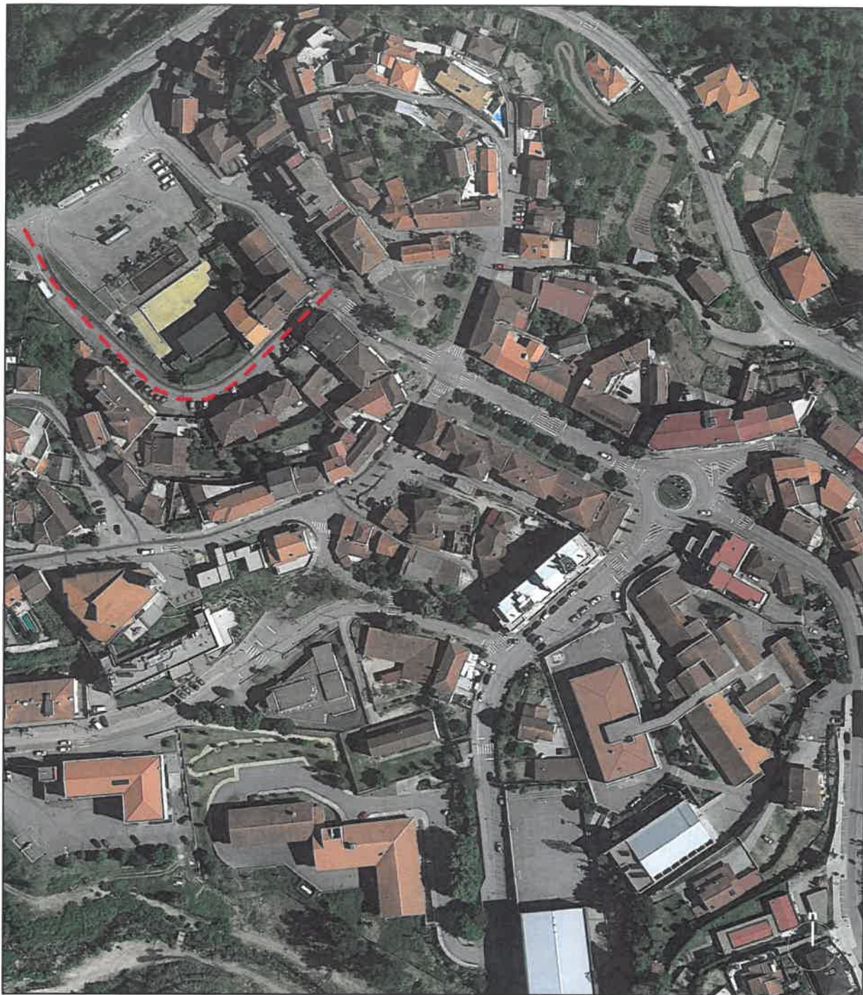
Extrato do Google Earth (a/escala)