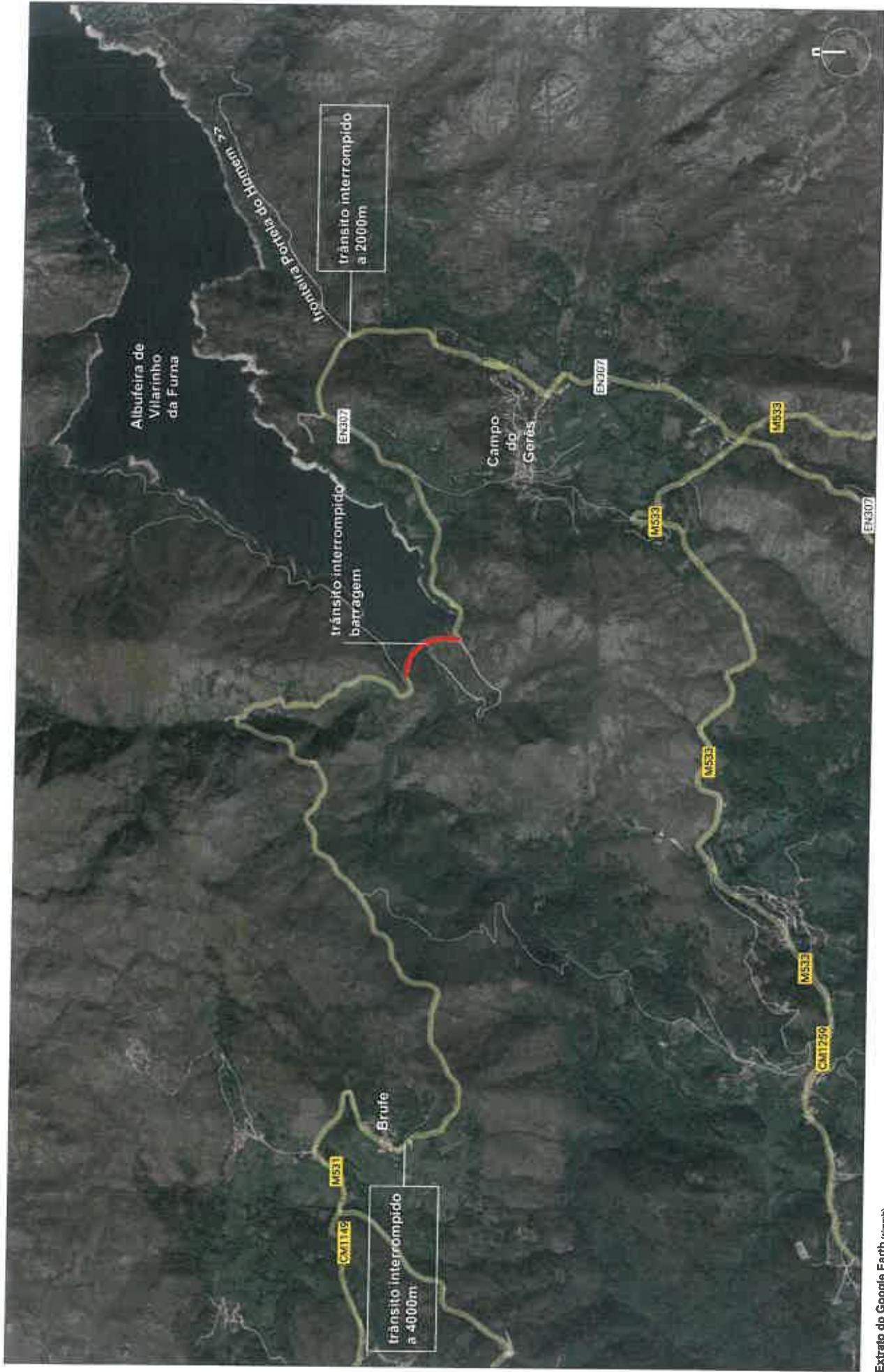
Extrato do Google Earth (2020/04)