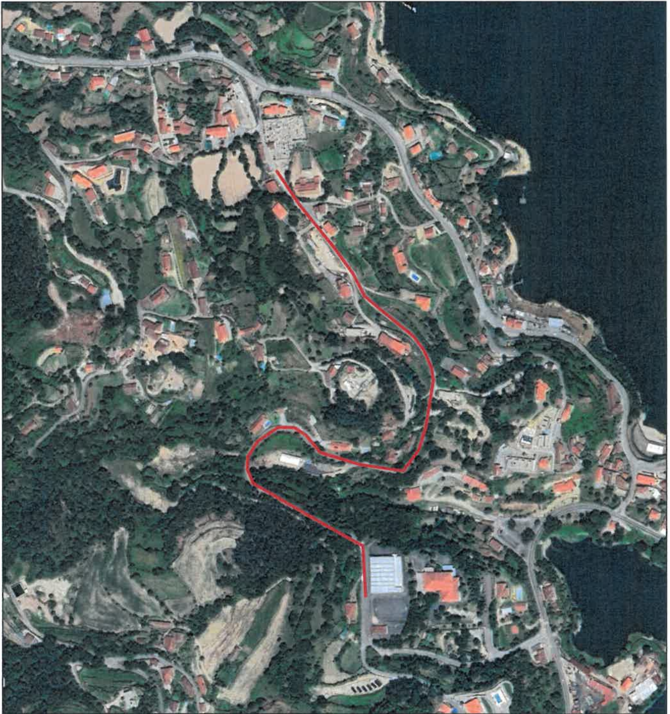
Extrato do Google Earth (a/escala)