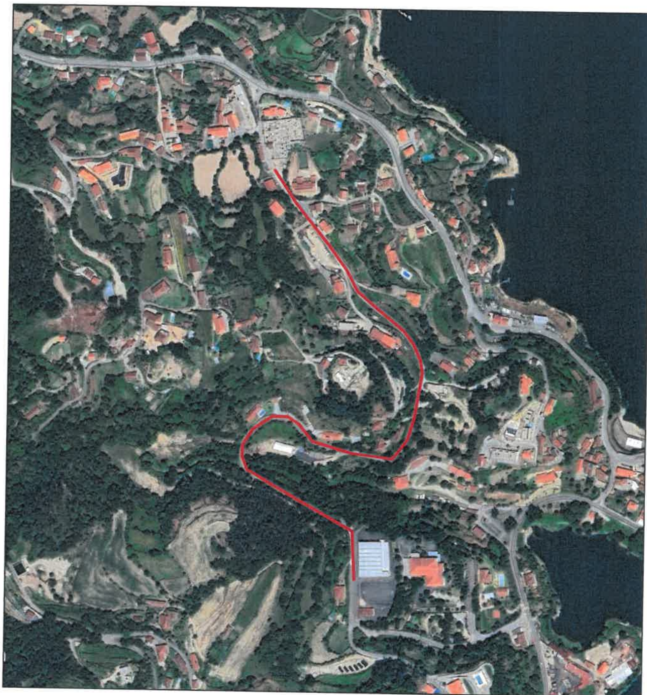
Extrato do Google Earth (a/escala)