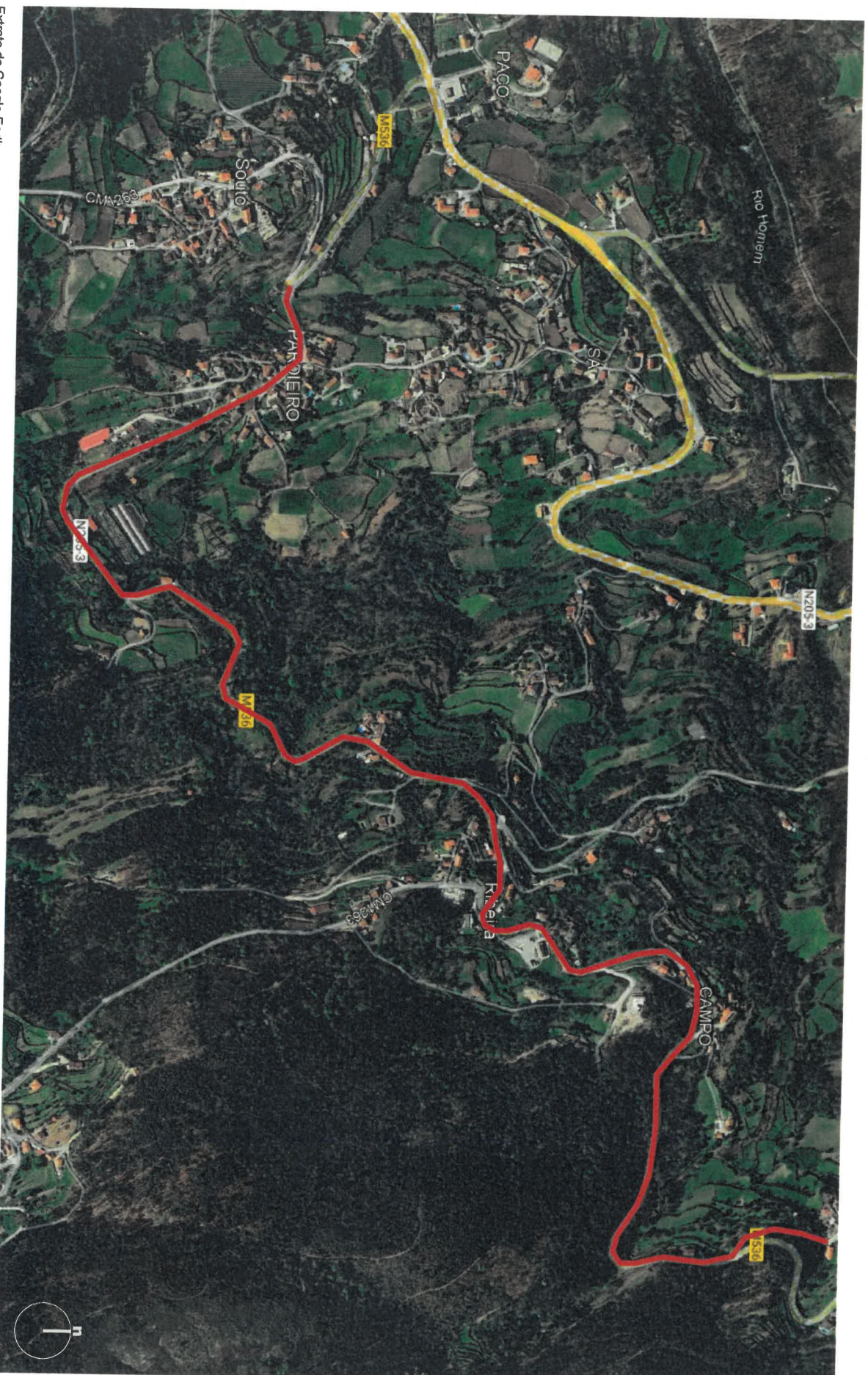
Extrato do Google Earth (aerial)